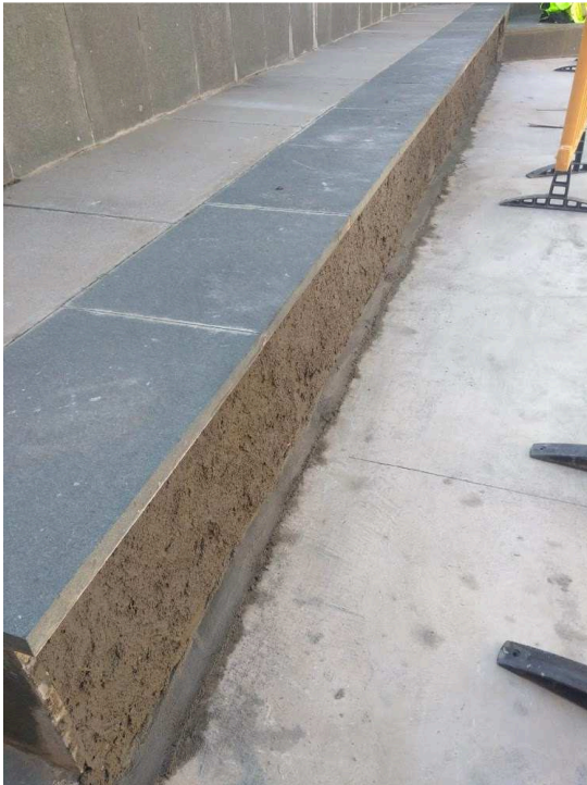
Retirada peces i reparació base.